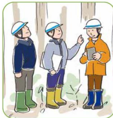
対象森林の現状把握

活動対象地となる森林において、標準的といえる場所に設ける。同じ林相(同じ目標)の活動対象地内の、最低1か所に設ける。