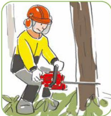
スギ・ヒノキの大径材生産林づくりを目指す

スギ・ヒノキの大径材生産林の整備・利用、広葉樹の森の整備・景観改善、生物多様性に富む森づくり、針広混交の複層林化、タケノコの採れる美しい竹林づくり、竹の侵入の防止など