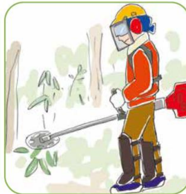
生物多様性に富む森づくり