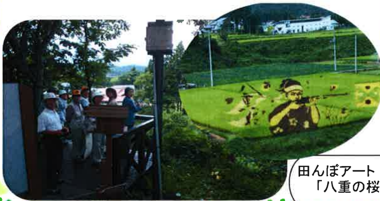
田んぼアート 「八重の桜」