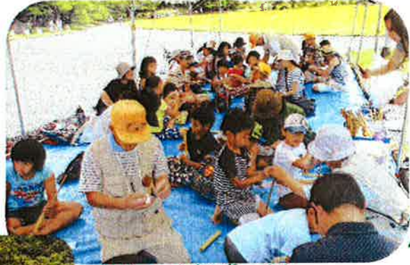
クラフト体験は、水鉄砲づくり

7月27日(日)開催 当日のスタッフ 森の案内人 16名・土地連 11名 朝、雨が降り、午前中は不安定な空模様で、時折小雨と強い風に悩まされましたが、午後からは、だいぶ天気も落ち着きました。 朝の天候の影響なのか、お客様の入りが、悪く準備したものが、余ってしまう・・・ことに、とても残念でした。