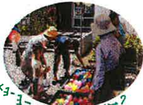
水質調べ 水ヨーヨー 何色にしよう?