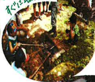
捕まえた魚は、すぐに塩焼きに