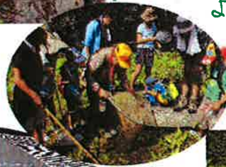
『なつかし難し』 『葉っぱの標本づくり』