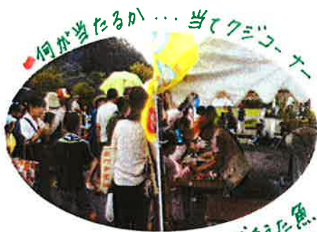
何が当たるか... 当てクイズコーナー