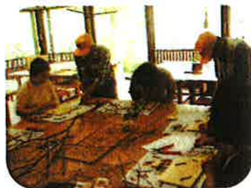
7月20日(日) 地元作谷沢地区の女性を中心に活動している「手作りの会」より5名の方がガクブチをつくりに!! 地区の文化祭に飾るそうです。