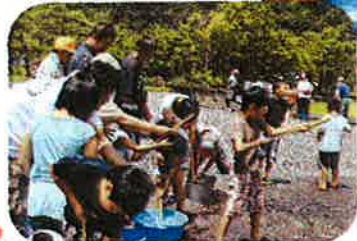
完成した水鉄砲で、射ちわらいます!