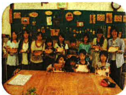
7月13日(日) 天童市荒谷「内条子ども会」 親子でガクブチづくりをしました。