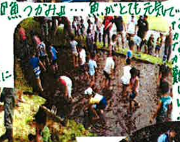
『魚つかみ』... 魚がとれ元気がいいか?!