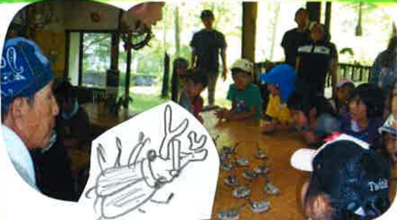
かぶと作品を鑑賞