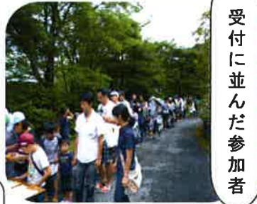
受付に並んだ参加者