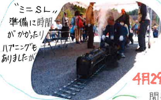
「ミニSL」準備に時間がかかったり、ハアニングもありました。