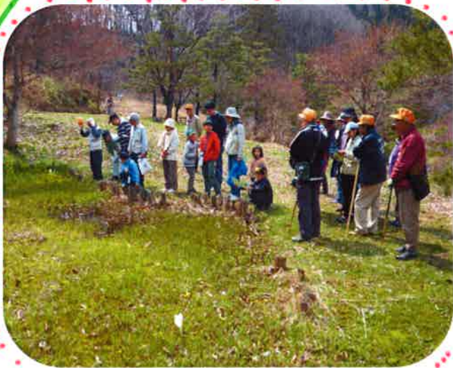
県民の森の春を見つけに!

前日まで肌寒く、曇っていて天候が心配されましたが、当日は朝から晴れわたり、オープニングイベントには約1250名のお客様に足を運んでいただきました。