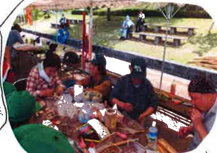
県民の森のパンフレットも持参しPRすると良かった。反響です。