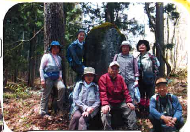
馬頭観音の前で参加者7名の記念撮影