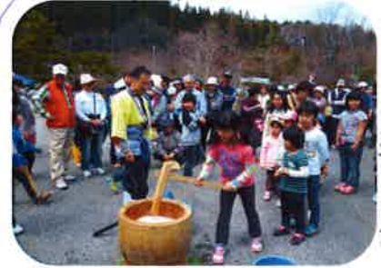
ふるまい餅にも長い列ができました。