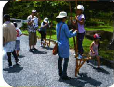
親子の手をとって 昔遊び体験