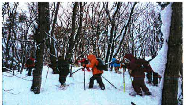
トレッキングの様子