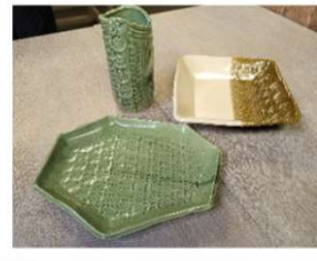
例) 葉っぱ模様のお皿