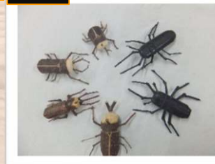
例) カブトムシ・クワガタムシ