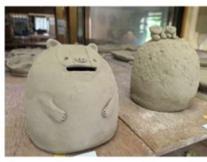
例) どうぶつ貯金箱